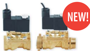
magnetický ventil GMV 191-M-XX: pro 3/4" kohouty nebo vodovodní potrubí