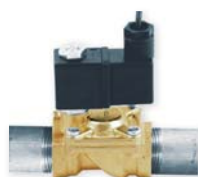
mosazný ventil GMV 191-M-1/2